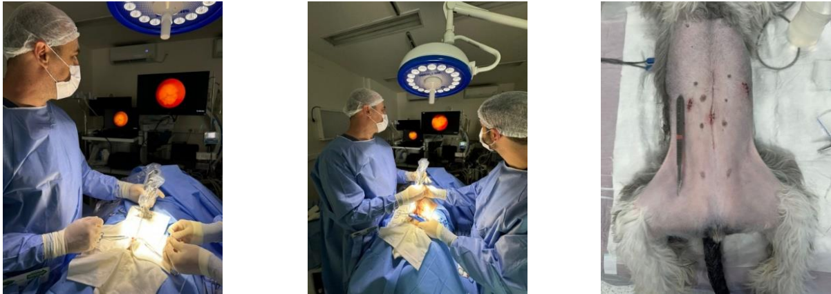
Figura 3. Imagem do médico veterinário em centro cirúrgico realizando a colecistectomia videolaparoscópica 3 portais; e demonstração das pequenas incisões pós videocirurgia em paciente. Cirurgia de colecistectomia videolaparoscopia realizada no dia 22 de agosto de 2023. Número de portais: 3 portais. Portais: 2 de 5 mm (linha média e lateral direito) e 1 de 10 mm (lateral esquerdo) Sutura: Vicryl 3-0 em musculatura e subcutâneo, Náilon 3-0 em pele. Intercorrências: Não. Volume CO 2 : 2,4L. Pressão média: 7 mmHg. Tempo de procedimento total: 1h. Tempo de procedimento insuflação/esvaziamento: 40 min. Coleta de materiais e fragmentos: 3 fragmentos hepáticos para Histopatológico, Vesícula biliar para histopatológico e Bile para cultura e antibiograma.

3,0 x 2,5 cm, com parede levemente irregular, com coloração acastanhada esverdeada. Foi realizada cultura com antibiograma (bactérias aeróbicas) da bile, onde não apresentou crescimento bacteriano, histopatológica biópsia hepática recebida de fígado e fragmento da VB, peças fixadas em formol a 10%, onde as conclusões foram: vesícula biliar - quadro morfológico favorece colecistite hiperplásica linfoplasmocitária multifocal discreta. Fígado - quadro morfológico favorecendo Hepatopatia crônica discreta com focos de degeneração vacuolar discreta (degeneração hidrópica) com mínimo infiltrado linfocítico multifocal. Sob alta médica no mesmo dia, paciente retornou a clínica após 15 dias para atendimento e retirada dos pontos e se mostrou em bom estado clínico geral.