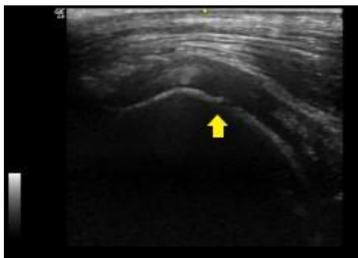
Figura 4. Ultrassonografia AEU, com discreta irregularidade na superfície cartilaginosa (seta amarela).

Após três meses de iniciado o tratamento, uma ultrassonografia articular foi realizada no ombro afetado para acompanhamento da lesão e melhor visualização da articulação escapulo umeral, onde foi notado discreta irregularidade na superfície da cartilagem umeral compatível com osteocondrose ( Figura 4 ).