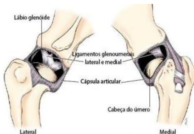
Figura 1. Estruturas anatômicas da articulação escapulo umeral esquerda de cão, nas vistas lateral e medial.

A predominância de casos se dá em cães de raças grandes ou gigantes, com aparecimento de sintomas em idade aproximada entre quatro a oito meses de vida e, em alguns casos a manifestação pode ser tardia. A OCD pode ser unilateral ou bilateral, sendo a última menos frequente. O principal sinal é a claudicação, que se intensifica, na maioria dos casos, após exercícios físicos ( Barone, 2015 ; Fragata & Santos, 2008 ; Johnson et al., 2005 ; Johnson et al., 2004 ).