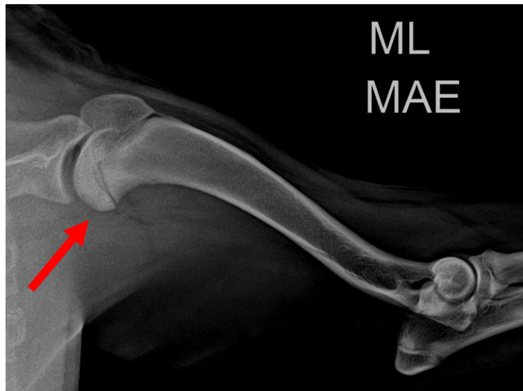
Figura 2: Aspecto radioluscente circular na cabeça do úmero esquerdo (ponta da seta).

esporadicamente, a paciente realizava bem os exercícios e a esteira proprioceptiva, sendo mantido a magnetoterapia e AINE.