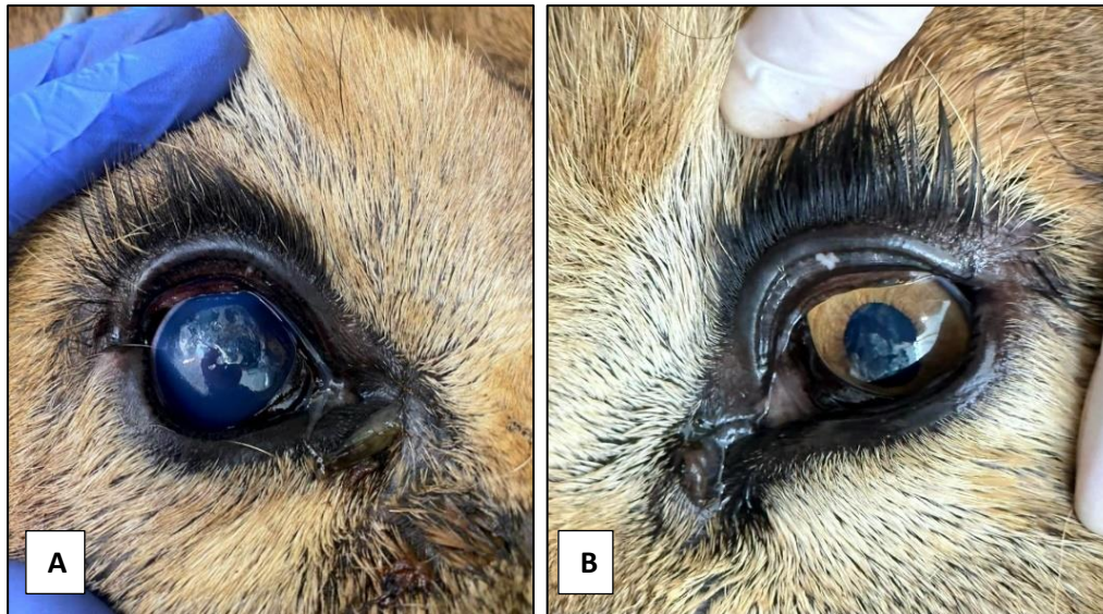
Figura 2. Leão-africano. A: Olho direito apresentando buphthalmia e intenso edema corneano. B: Olho esquerdo, sem alterações.

acondicionamento e transporte do mesmo, uma sedação prévia foi realizada em seu recinto de origem por meio de dardo para captura, a administração de tiletamina-zolazepam (Telazol ® ) na dose de 3 mg/kg por via intramuscular. Como não foi observada possibilidade de manuseio em sua chegada nas dependências do hospital veterinário da UFPR, um segundo dardo contendo 5 mcg/kg de dexmedetomidina (Dexdomitor ® 500 ug/mL), 0,2 mg/kg de metadona (Mytedom ® 10 mg/ml) e 2 mg/kg de dextrocetamina (Ketamin ® 50 mg/ml) foi administrado por via intramuscular em membro pélvico direito. Decorridos quinze minutos, o animal apresentava-se suficientemente sedado, o que permitiu a sua retirada da caixa de transporte e seu encaminhamento para o centro cirúrgico.