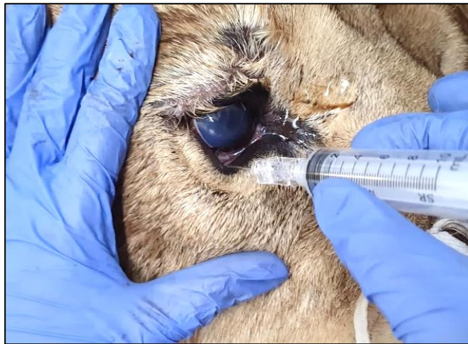
Figura 3. Realização do bloqueio retrobulbar com agulha de Tuohy 20G em paciente da espécie Panthera leo , atendido no Hospital Veterinário da Universidade Federal do Paraná para procedimento cirúrgico de enucleação.

A cirurgia de enucleação foi realizada pela técnica transconjuntival e tanto o olho afetado quanto os anexos oculares foram enviados para análise histopatológica. Por segurança da equipe multidisciplinar, o encerramento das infusões foi realizado ao fim do procedimento, e a extubação, realizada na caixa de transporte com o animal moderadamente sedado. Como indícios de superficialização anestésica, foram avaliados reflexo de contração muscular das orelhas, reflexo palpebral, movimento da língua e levantar da cabeça. Não foram necessários reversores anestésicos, sendo o tempo de recuperação aproximado de 30 minutos.