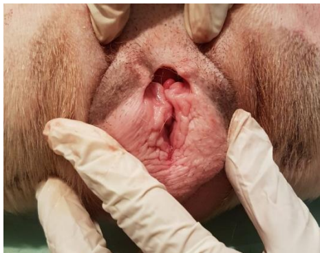
Figura 1. Exame físico específico do sistema genital feminino de cadela da raça Bulldog Inglês de 10 meses de idade com piometra, atendida no Hospital Veterinário da UFRRJ sendo possível visualizar edema de vulva.

Na avaliação específica observou-se sensibilidade à palpação abdominal, edema de vulva e secreção vulvar muco/hemorrágica ( Figura 1 ).