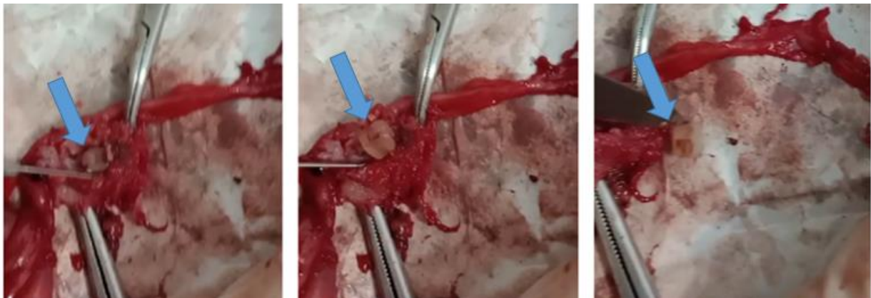
Figura 3. Processo de remoção do laço plástico de dentro do granuloma.

Como acompanhamento pós-operatório, em 48 horas solicitou-se hemograma e dosagem de enzimas renais, onde a paciente apresentou anemia normocítica normocrômica, trombocitose, redução da azotemia (creatinina de 3,4 mg/dL para 2,08 mg/dL e ureia de 115 mg/dL para 53 mg/dL). Assim, a equipe optou por iniciar a administração de eritropoetina 150 UI SC em dias alternados. A paciente foi mantida em acompanhamento semanal, onde observou-se redução gradativa das enzimas renais, bem como melhora do hematócrito.