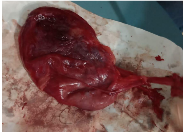
Figura 2. Rim direito nefrectomizado.

Para casa, foi prescrito como protocolo pós-operatório, dipirona sódica 25 mg/kg BID VO por cinco dias, cloridrato de tramadol 4 mg/kg BID VO por cinco dias, prednisolona 0,5 mg/kg SID VO por 10 dias, amoxicilina com clavulanato de potássio 15 mg/kg BID VO por 10 dias e hidróxido de alumínio 30 mg/kg TID VO até novas orientações. Como manejo para pacientes renais, indicou-se a troca de ração para alimentação natural, com menor teor proteico e menores concentrações de fósforo e potássio, tornando o alimento mais palatável e com maior digestibilidade, reduzindo os níveis de compostos nitrogenados que poderiam agravar a injúria renal.