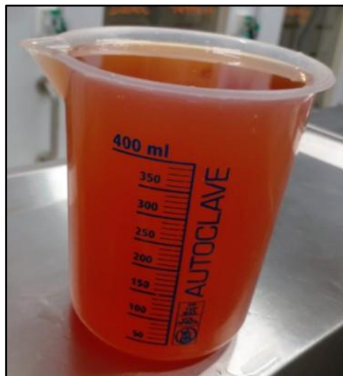
Figura 1. 600 ml de líquido serosanguinolento drenado por meio de toracocentese no hemitórax direito.

O paciente evoluiu de forma positiva nas primeiras 24 horas, cessando a tosse e a hemoptise. Entretanto, ele começou a apresentar um esforço respiratório misto com padrão abdominocostal. Na madrugada foi realizada uma ultrassonografia torácica que evidenciou discreta efusão pleural do lado esquerdo e moderada do lado direito. Foi optado por realizar uma toracocentese, quando foram retirados aproximadamente 600 ml de conteúdo serosanguinolento ( Figura 1 ) do hemitórax direito. Após o procedimento, houve uma melhora significativa do padrão respiratório.