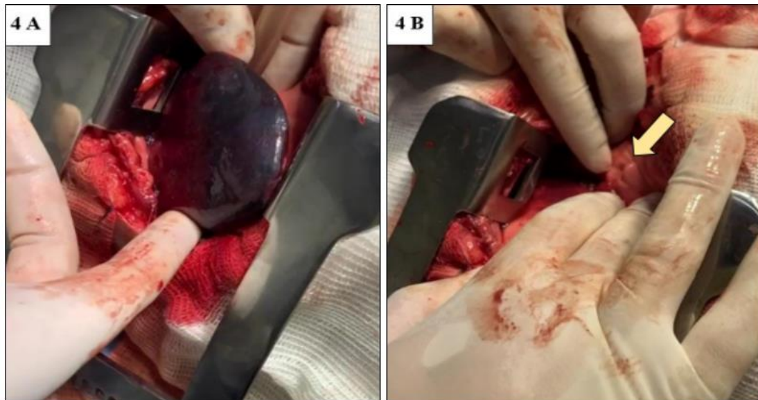
Figura 4. (A) Porção do lobo cranial esquerdo congestionado e com aspecto hepatizado; (B) Fístula encontrada na porção caudal do lobo cranial esquerdo (seta amarela).

(Figura 4B) que foi corrigida com sutura em pontos simples separado (com nylon 6-0) e cola cirúrgica, posteriormente foi executado outro “teste do borracheiro” e não houve extravasamento de ar.