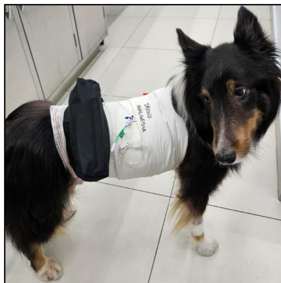
Figura 5. Paciente fazendo o uso de uma bomba elastomérica que está dentro de uma bolsa de armazenamento.

O paciente foi admitido na internação após a cirurgia e no retorno anestésico se manteve agitado, apresentando um episódio de tosse que durou alguns segundos, mas os parâmetros mantiveram-se dentro da normalidade e sem algia em topografia cirúrgica. Oito horas após a cirurgia foram drenados 350 ml de líquido serosanguinolento pelo dreno torácico. Um dia após a cirurgia o paciente começou a fazer o uso de uma bomba elastomérica com lidocaína (2 ml/hr) que ficou dentro de uma bolsa de armazenamento (Figura 5). Devido a diminuição de dor no local da incisão, o dreno de analgesia foi retirado dois dias após a cirurgia. O paciente evoluiu de forma positiva, recebendo alta quatro dias após a cirurgia.